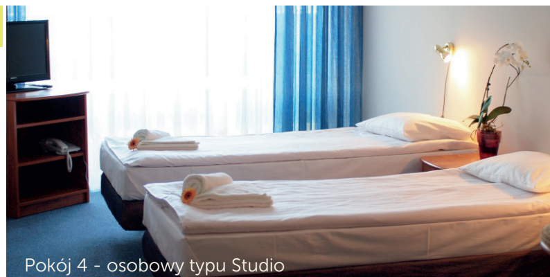
Pokój 4 - osobowy typu Studio