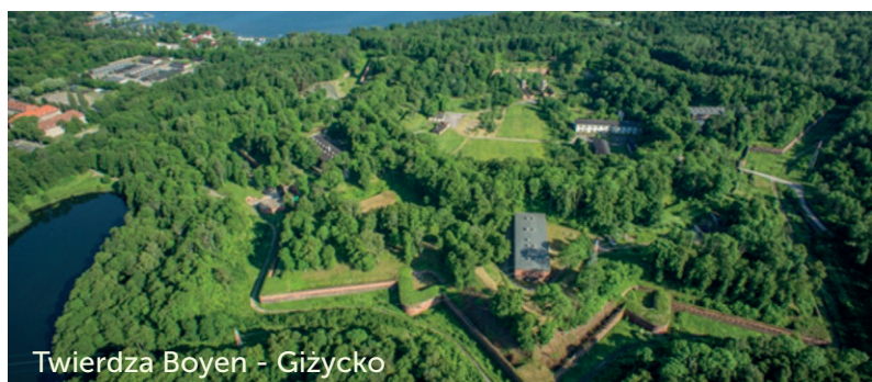
Twierdza Boyen - Giżycko